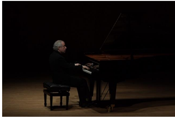
3/17 サー・アンドラーシュ・シフ