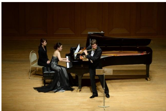
4/26 カール=ハインツ・シュツツ