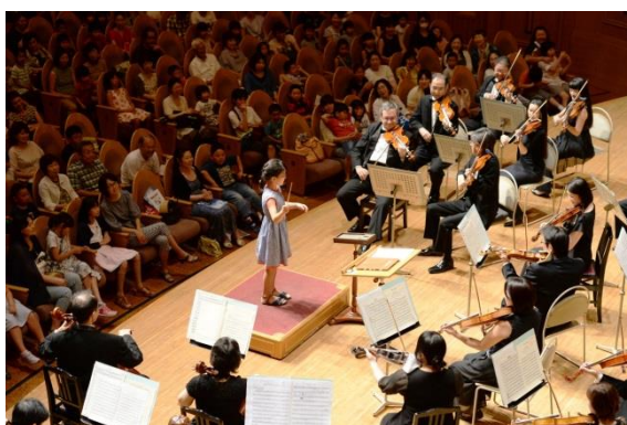
8/2 いずみ子どもカレッジ2016