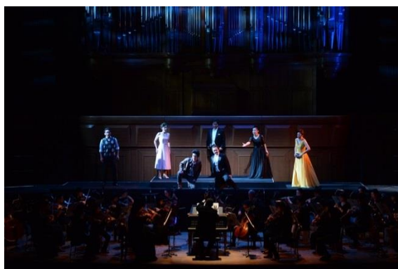
9/3 オペラ「ドン・ジョヴァンニ」