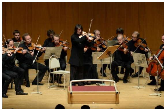
6/10 ユーリ・バシユメット&モスクワ・ソロイスツ