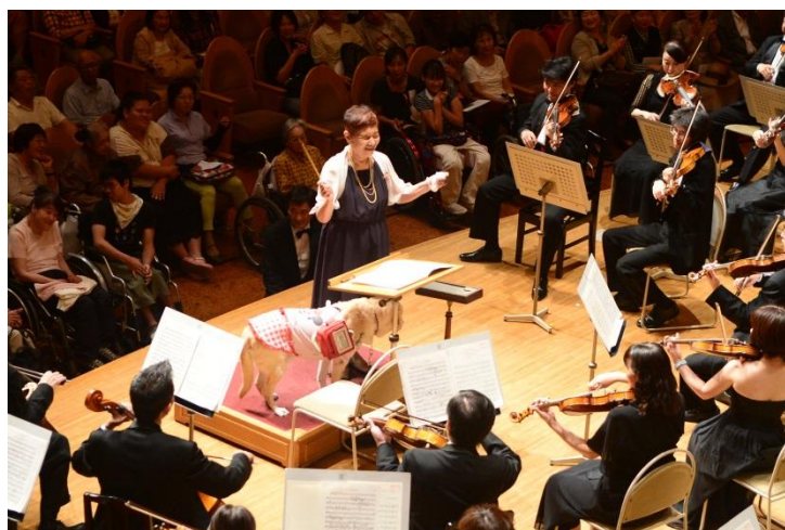
9/26 いずみホール夢コンサート