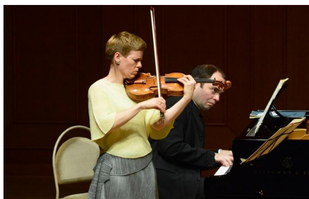
6/24 イザベル・ファウスト&A・メルニコフ