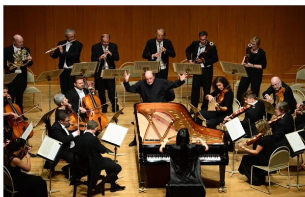
10/2 ロジャー・リントン&チューリヒ室内管