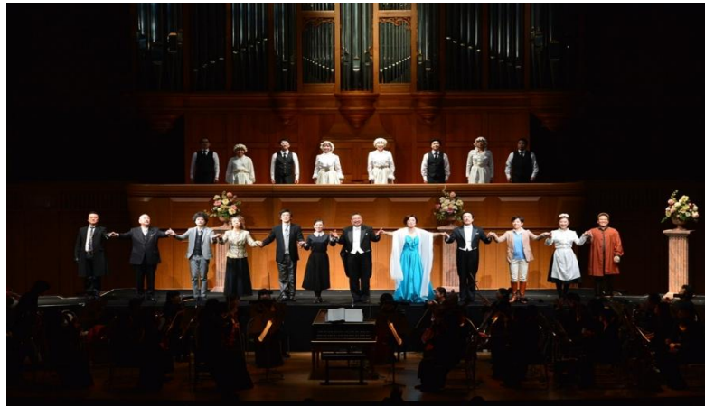
12/6 Ⅲ.「ここにはすべてがある」歌劇「フィガロの結婚」