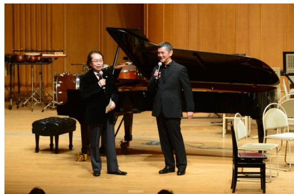
1/24 いずみシンフォニエッタ大阪 第34回定期演奏会