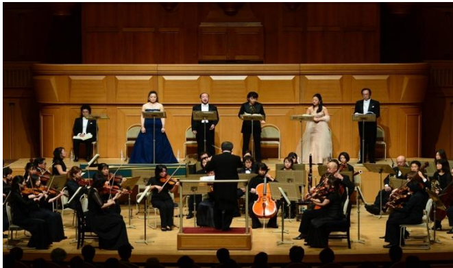
12/14「オペラで勝負する」