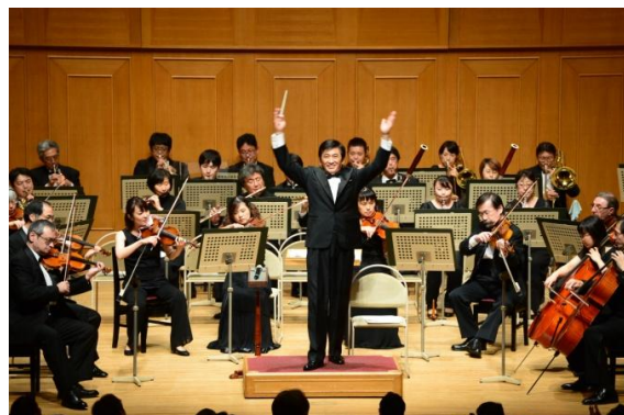
指揮者が手話であいさつ