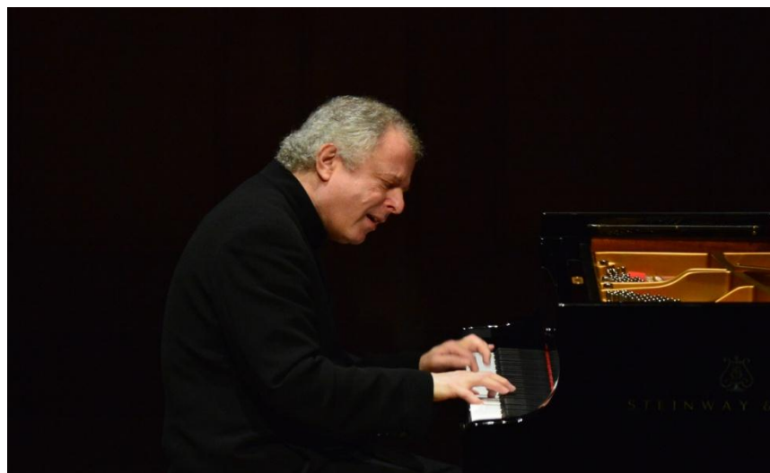
3/12アンドラーシュ・シフ