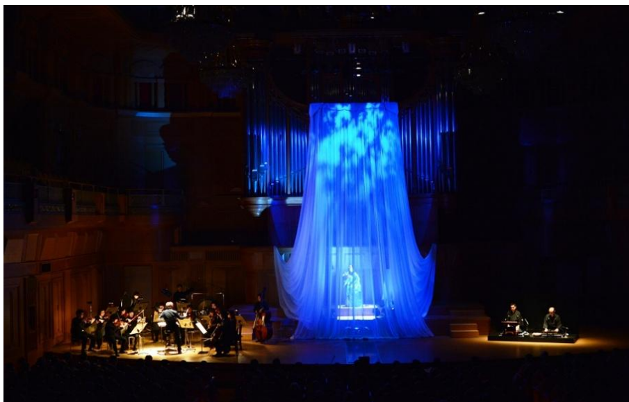
1/31いずみシンフォニエッタ大阪第32回定期演奏会