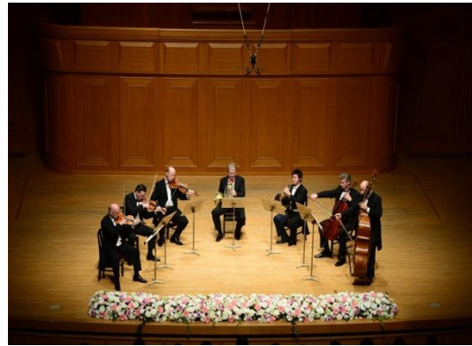
1/11「室内楽はのびやかに」