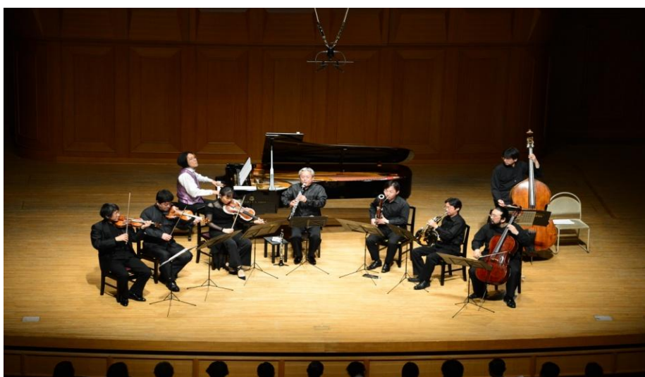
5/29宮川彬良&アンサンブル・ベガ