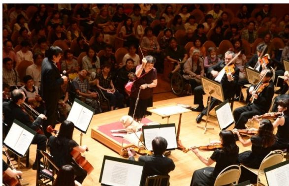
指揮者体験コーナー