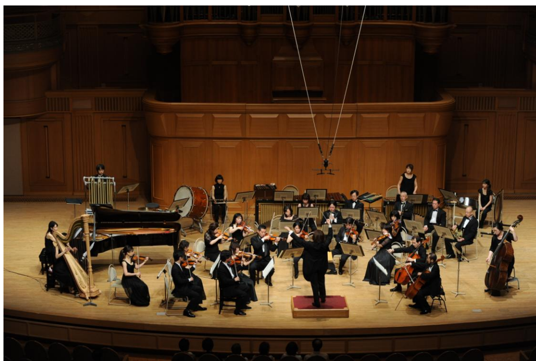
7/8 いずみシンフォニエッタ大阪 第27回定期演奏会