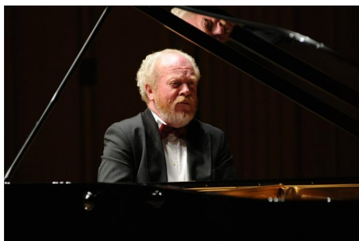
12/16 リスト ～時代を拓くピアノ～ ゲルハルト・オピッツ